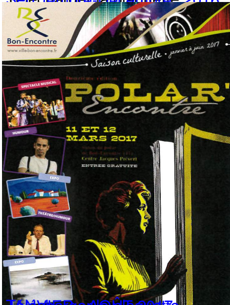
Janvier et Mars 2017