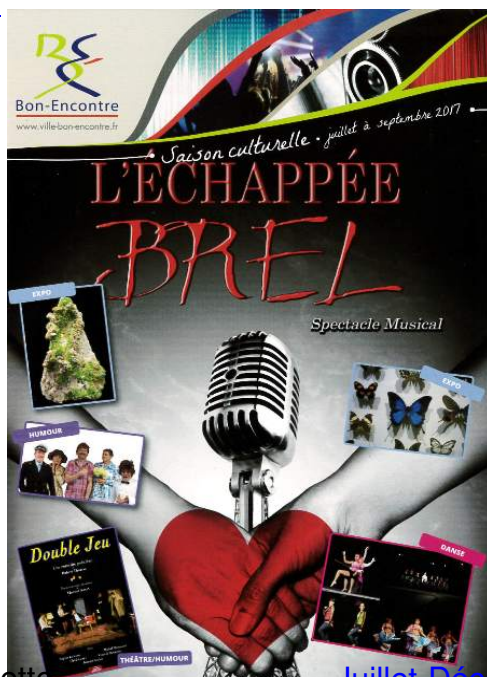
Télécharger la plaquette