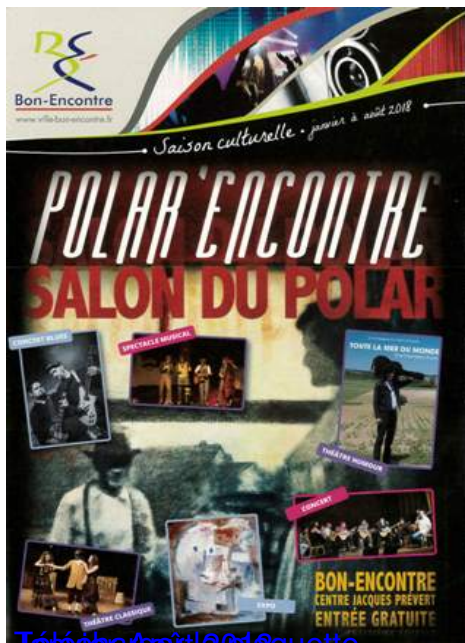
Télécharger la plaquette