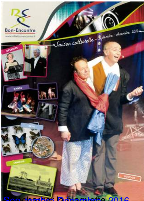
Séances d'opérette 2016