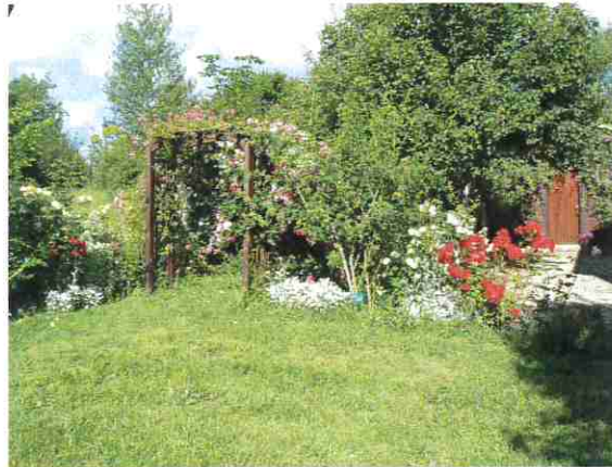
Jardin Botanique - Roseraie

Botanistes, mycologues, entomologistes, découvrent sur les deux hectares mis à la disposition par le SIVU de Bon-Encontre – Pont-du-Casse, une nature préservée.