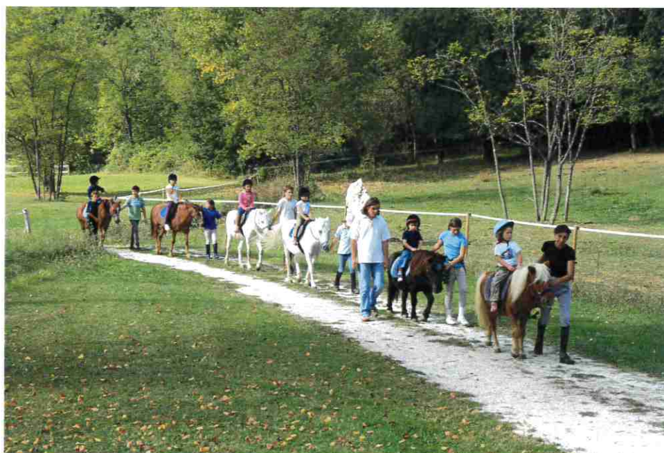
Site du SIVU de Darel - Poney Club