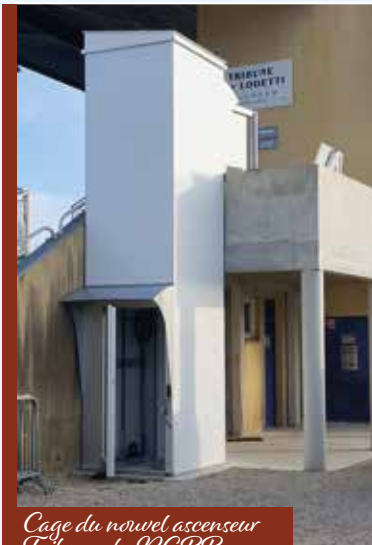
Cage du nouvel ascenseur Tribune du RCBB.