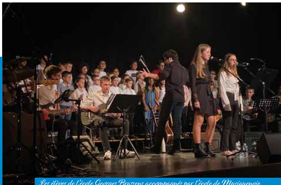
Les élèves de l'école Georges Brassens accompagnés par l'école de Musiquenvie

Consciente de la dimension éducative, enrichissante et épanouissante que revêt une politique culturelle, la municipalité veut proposer des animations culturelles accessibles à tous.