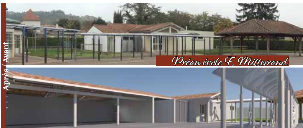
Préau école F. Mitterrand