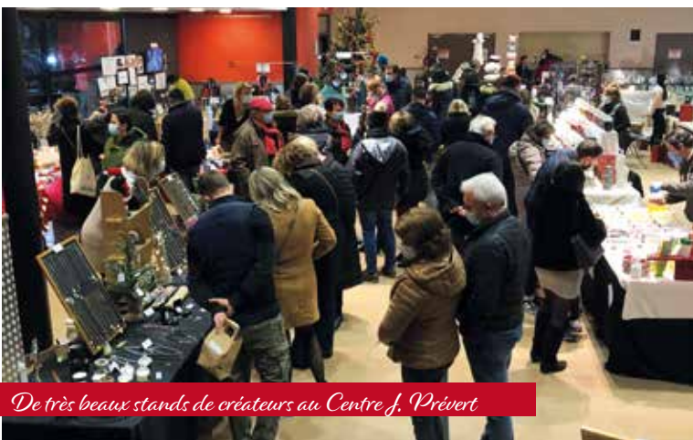
De très beaux stands de créateurs au Centre J. Prévart

Cette 1 ère édition du marché de Noël municipal a remporté un franc succès : plus de 2000 visiteurs et une quarantaine d'exposants, artisans, créateurs et producteurs, des associations ainsi que des animations gratuites ont animé ce site de 16h30 à 23h. Nos associations, nos élus, nos bénévoles ont œuvré tous ensemble pour redonner un peu de baume au cœur à tous, il n'est nul doute que notre Noël'Encontre connaîtra une seconde édition !