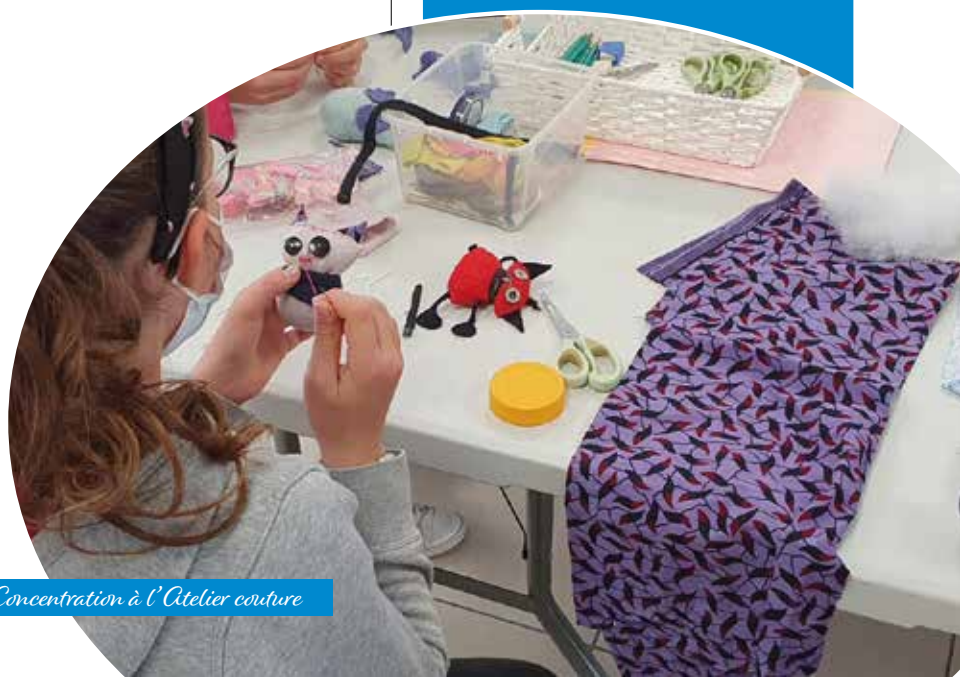
Concentration à l'Atelier couture

Téléchargez l'appli BIBENPOCHE pour réserver vos livres et être informés sur les nouveautés !