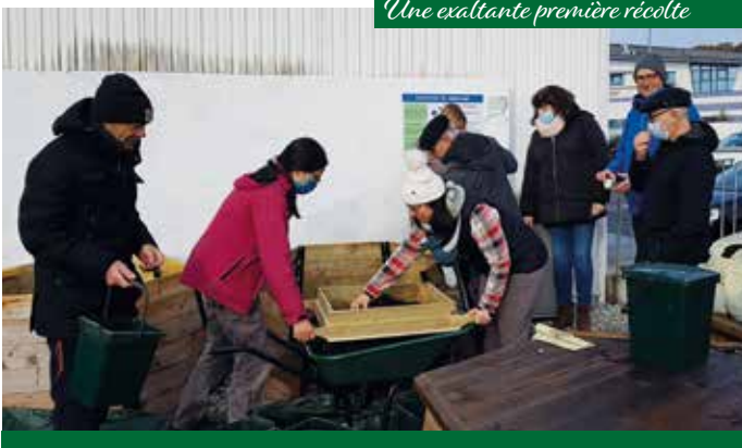
Une exaltante première récolte