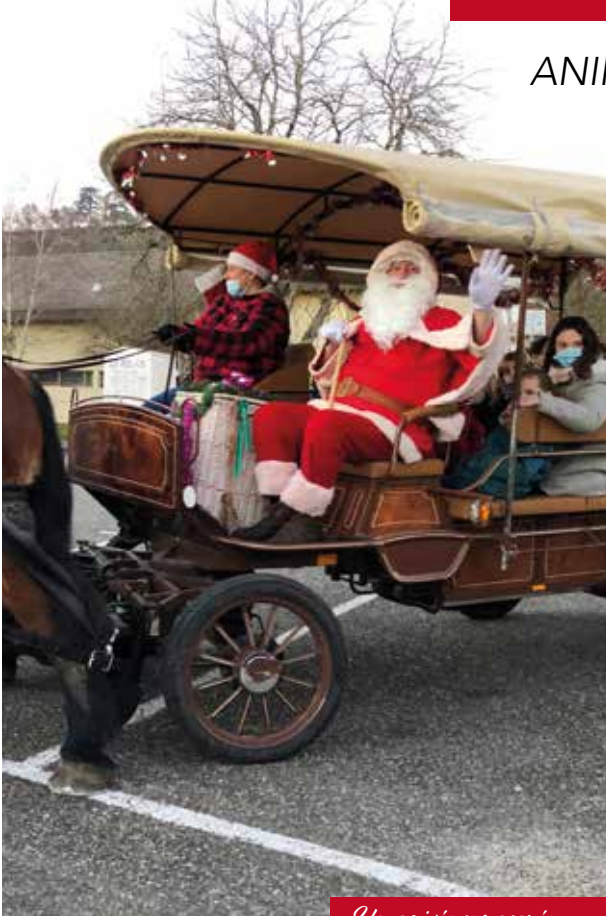
Un arrivée remarquée

Balades en calèche dans le Bourg de Bon-Encontre, karting électrique pour petits et grands, piste de curling mais aussi un magnifique studio photo où le père Noël n'a cessé de poser avec les enfants grâce à l'association «Images Nouvelles». Un somp-