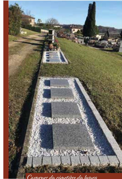
Cavurnes du cimetière du bourg

A ce jour il reste quelques alvéoles de columbarium disponibles sur le site cinéraire du bourg.