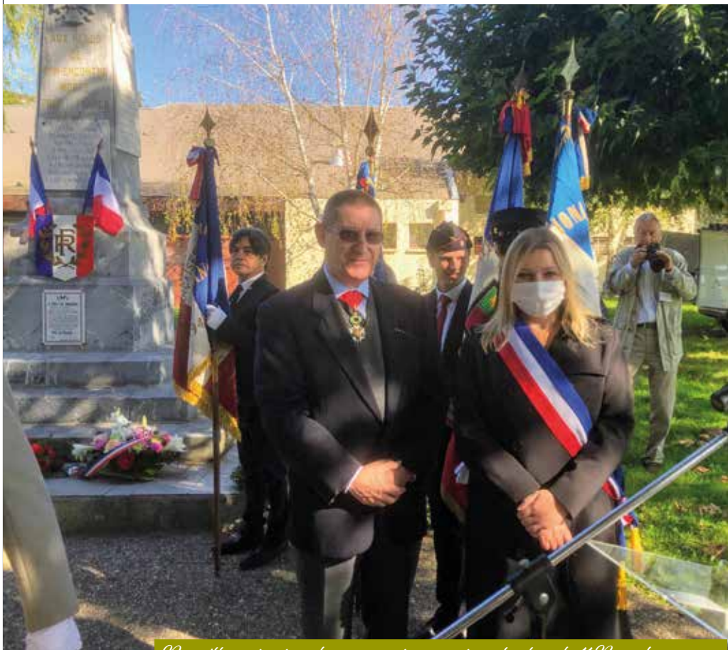
Recueillement autour du monument aux morts sur la place du 11 Novembre